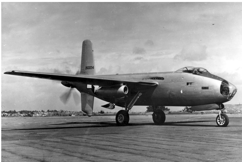
XB-42 mit Zusatztrieb- werken Westinghouse 19XB-2A unter der Fläche

Compiled and edited by Johannes Wehrmann 2014 Source of Details Wikipedia and Internet