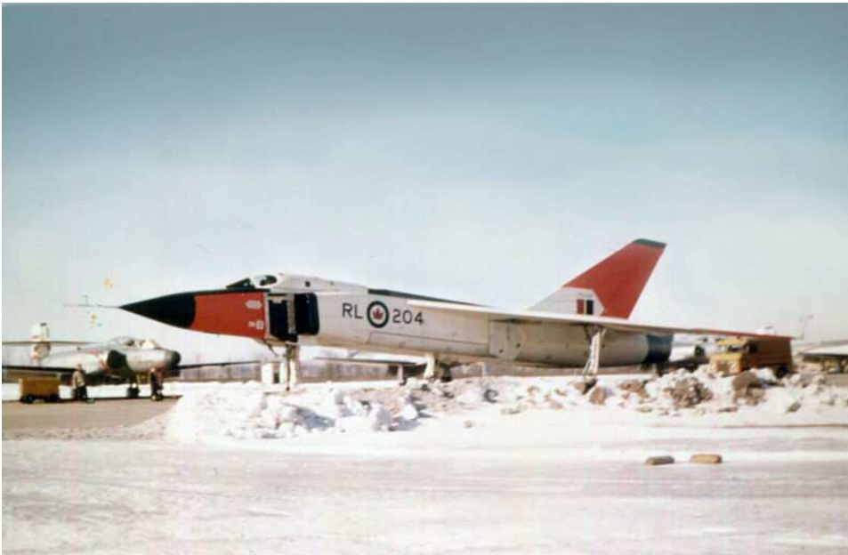
Avro Arrow CF-105 No. RL 204 im Jahre 1959 auf einer kanadischen Airbase

Compiled and edited by Johannes Wehrmann 2014 Source of Details Wikipedia and Internet