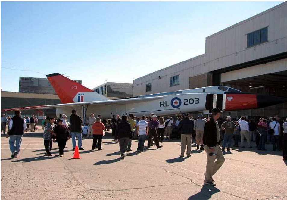
Avro Canada CF-105 „Arrow“ (Nachbau im Toronto Aerospace Museum)

September 1958 wurde das Astra-/Sparrow-Programm beendet, am 20. Februar 1959 folgte das endgültige Aus kurz vor der Fertigstellung des sechsten Prototypen.