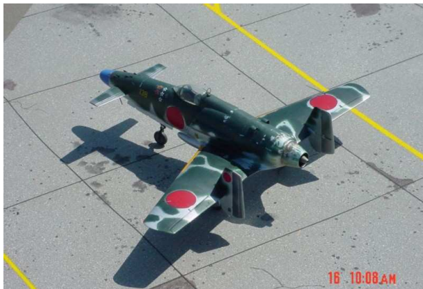
nicht mehr geplante J7W2 Shinden mit Düsentriebwerk als Modell